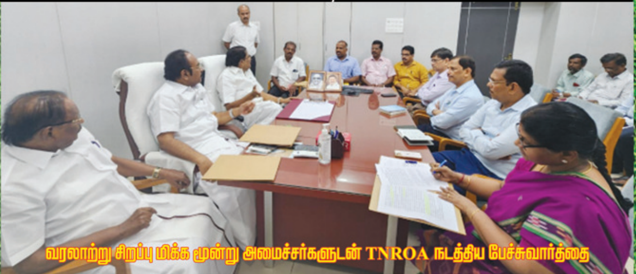
வரலாற்று சிறப்பு மிக்க மூன்று அமைச்சர்களுடன் TNROA நடத்திய பேச்சுவார்த்தை