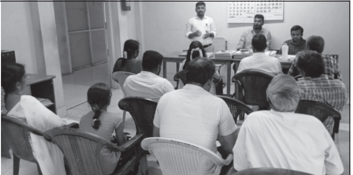
கரூர் மாவட்டம் கிருஷ்ணராயபுரம் வட்டத்தில் மாநிலச் செயலாளர் செந்தில்குமார் பரப்புரை