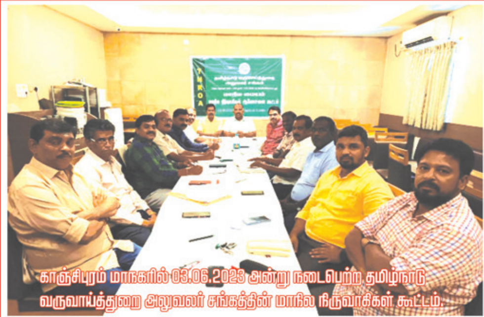
காஞ்சிபுரம் மாநகரில் 03.06.2023 அன்று நடைபெற்ற தமிழ்நாடு வருவாய்த்துறை அலுவலர் சங்கத்தின் மாநில நிருவாகிகள் கூட்டம்.