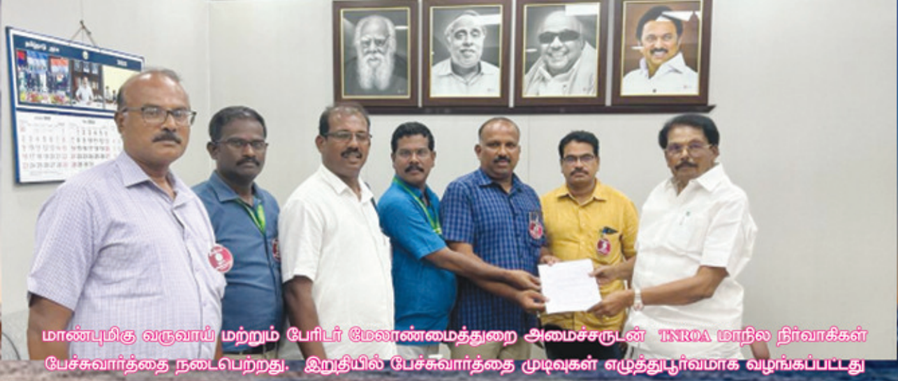
மாண்புமிகு வருவாய் மற்றும் பேரிடர் மேலாண்மைத்துறை அமைச்சருடன் TNROA மாநில நிர்வாகிகள் பேச்சுவார்த்தை நடைபெற்றது. இறுதியில் பேச்சுவார்த்தை முடிவுகள் எழுத்துப்பூர்வமாக வழங்கப்பட்டது