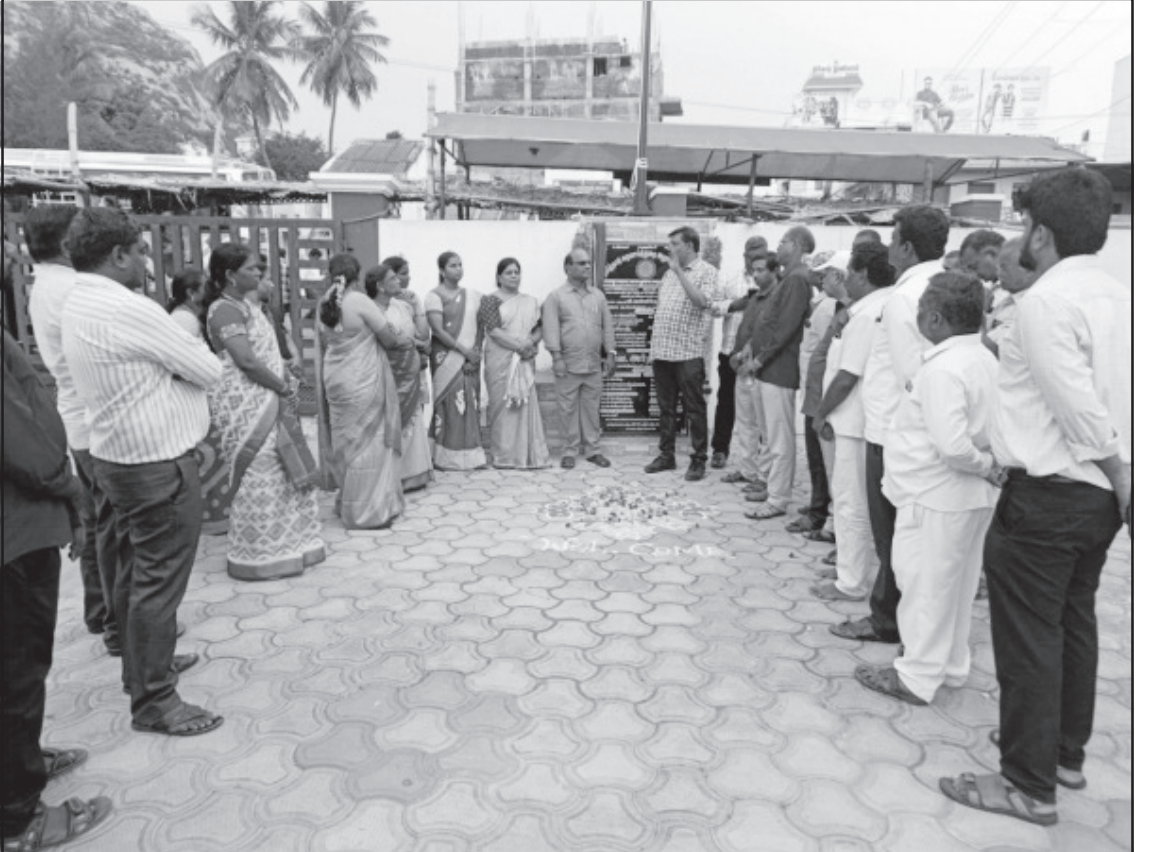
சேலம் மாவட்டத்தில் நடைபெற்ற சங்கக் கொடியேற்று விழாவில் மாநிலத் துணைத் தலைவர் தோழர் அர்த்தநாரி