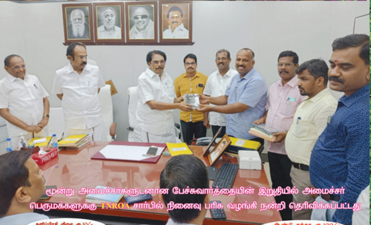
மூன்று அமைச்சர்களுடனான பேச்சுவார்த்தையின் இறுதியில் அமைச்சர் பெருமக்களுக்கு TNROA சார்பில் நினைவு பரிசு வழங்கி நன்றி தெரிவிக்கப்பட்டது

தனிப்பிரதி விலை ரூ.10/- Per Copy Rs.10/-